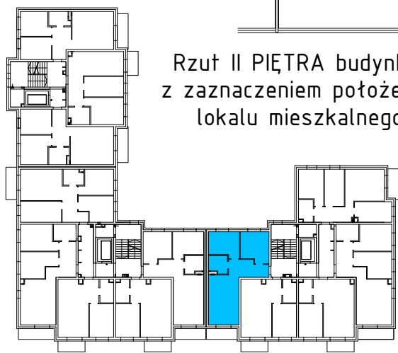
Rzut II PIĘTRA budynku z zaznaczeniem położenia lokalu mieszkalnego